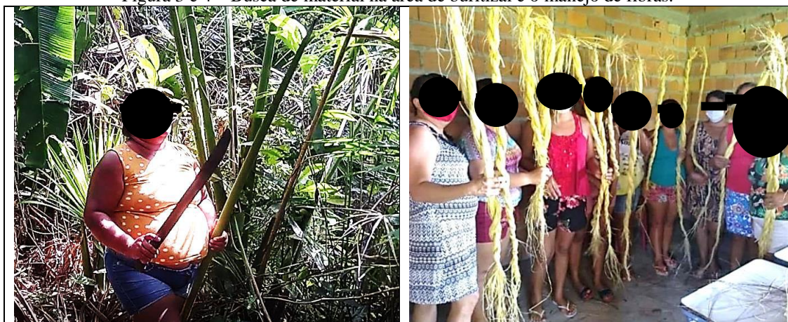
Figura 3 e 4 – Busca de material na área de buritizal e o manejo de fibras.

Mas tudo muda e as parcerias vão sendo construídas, tempos depois pudemos pôr em prática a construção do nosso tão ansiado centro cultural, batizado “Recanto das Mulheres” (Sede própria), cuja obra pôde ser executada a partir do advento de recursos advindos da contemplação do grupo nos editais da Lei Aldir Blanc (LAB 14.017/2020), ne meninas? Segundo (E1, 2025).