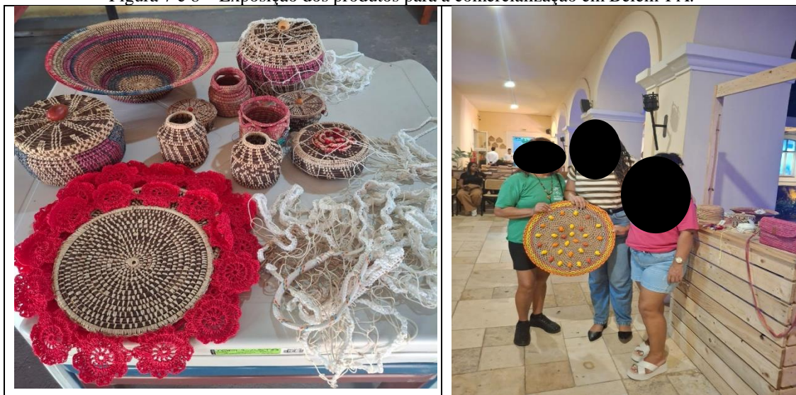
Figura 7 e 8 – Exposição dos produtos para a comercialização em Belém-PA.

(E4, 2025) reforça que essa organização foi o que nos permitiu "tirar as mulheres da cidade para ficarem na comunidade", substituindo o trabalho doméstico precarizado pela gestão democrática do próprio recurso. A transparência é garantida por registros em cadernetas e reuniões mensais onde, como destaca (E3, 2024), o processo é prazeroso e funciona como uma "terapia", pois o fundo coletivo atua como um seguro social para emergências. Assim, o clube materializa o conceito de território de refúgio de Santos (2000), ao criar uma "horizontalidade" que protege as associadas das perversidades do sistema financeiro tradicional, garantindo que o "nosso suor", termo usado por (E2, 2025) ao recordar perdas passadas seja agora protegido por uma gestão coletiva e soberana e possível. Segundo as (Figuras 7 e 8).