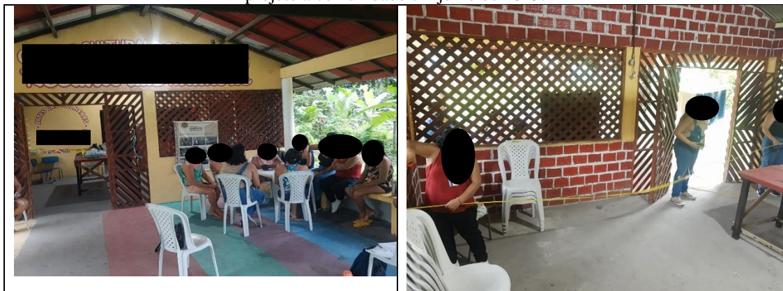
Figura 9- Reunião do coletivo sobre as suas demandas para o projeto de cozinha comunitária, 10- Medição do espaço, 11- Apresentação do projeto básico de cozinha comunitária ao grupo, 12- Entrega do projeto a comunidade em julho de 2025.

Nesse contexto o manguezal assume a centralidade da vida, segundo (E5, 2024) Nós ribeirinhos é a nossa riqueza, o mangal, dá para viver sem ele? Não. Porque a gente vai, tira um caranguejo, tira um turu, um siri ou um amuré. É a raiz do mangue é a nossa medicação, pegamos a raiz do mangue, quando a pessoa está com uma diarreia muito forte, inclusive, semana passada minha mãe passou por uma situação e a gente teve que tirar ela lá da Unidade de Pronto Atendimento – UPA, porque senão a gente ia encaminhar ela pra Paragominas. E o remédio dela foi a raiz do mangue.