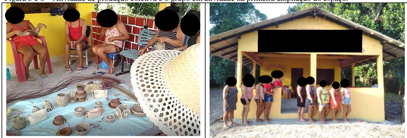
Figura 5 e 6 – Atividade de produção coletiva e o grupo em atividade na primeira ampliação do espaço.

onde a "família" e a proteção coletiva descritas pelas colaboradoras funcionam como o que Santos (2000) denomina de "horizontalidades": redes de cooperação que nascem da base e fortalecem o sentido de pertencimento e sobrevivência coletiva. Conforme as (Figuras 5 e 6).