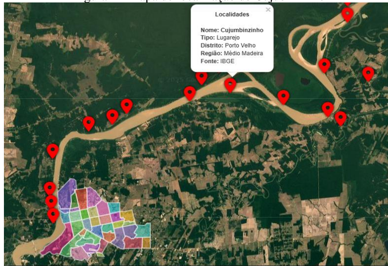
Figura 1 - Mapa de localização de Cujubinzinho