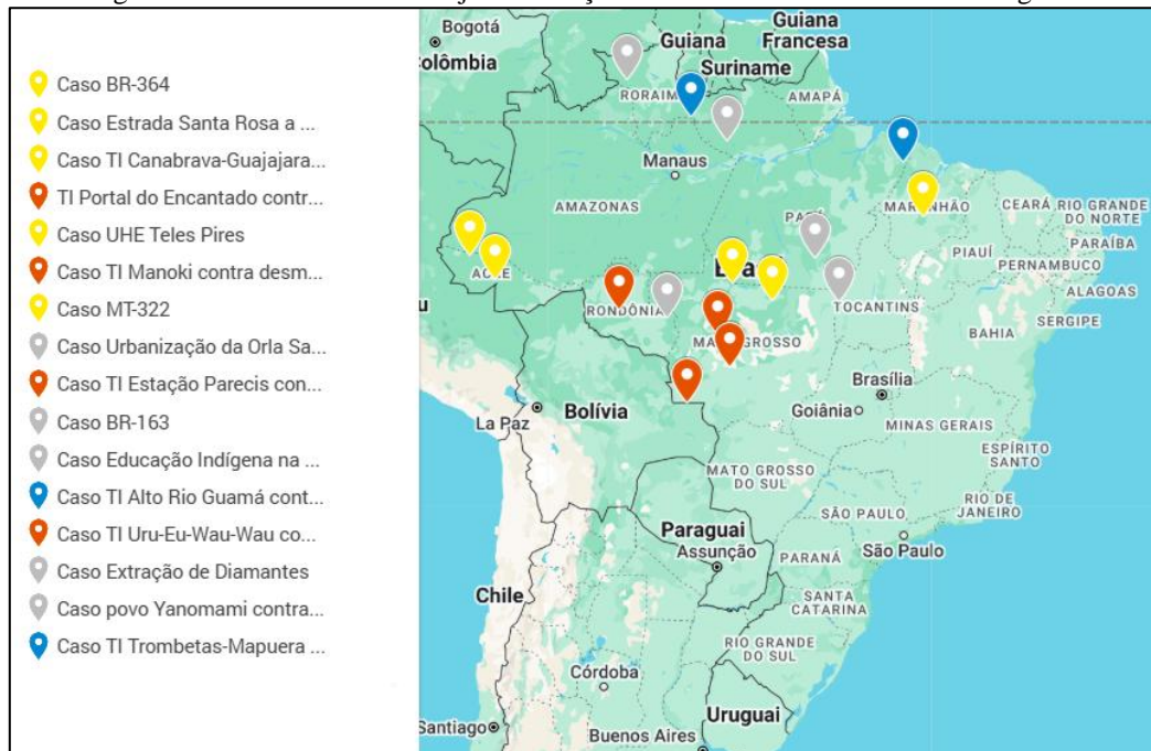
Figura 5 – Casos envolvendo a judicialização do desmatamento em Terras Indígenas

Com isso, realizou-se o mapeamento 6 dos casos analisados, constando a localização e o resumo dos casos: