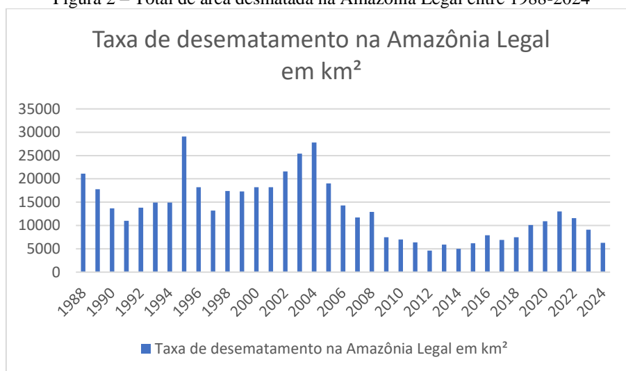
Figura 2 – Total de área desmatada na Amazônia Legal entre 1988-2024

Fonte: INPE (2025). Elaboração: autores.