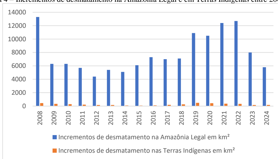
Figura 4 – Incrementos de desmatamento na Amazônia Legal e em Terras Indígenas entre 2008-2024

Fonte: INPE (2025). Elaboração: autores.