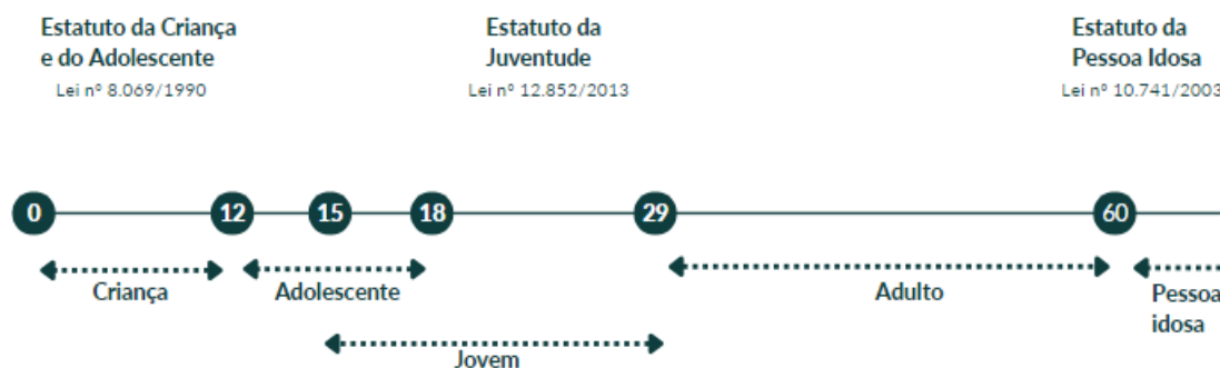
Figura 1. Fases da vida no direito brasileiro, segundo o critério cronológico